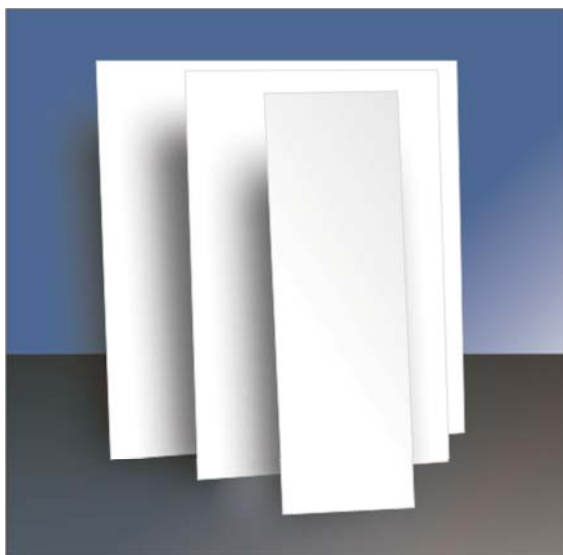
Abb.: Soundspot Richtlautsprecher

Die Installation der Richtlautsprecher erfolgt abgehängt von der Decke oder in die Kassettendecke integriert (62,5 cm x 62,5 cm) und erfordert nur minimale bauliche Eingriffe.